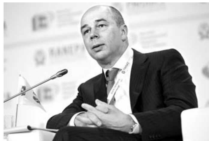
Министр финансов РФ Антон Силуанов: «Сейчас мы уходим от нефтегазовой зависимости, слезаем с так называемой «ресурсной иглы»