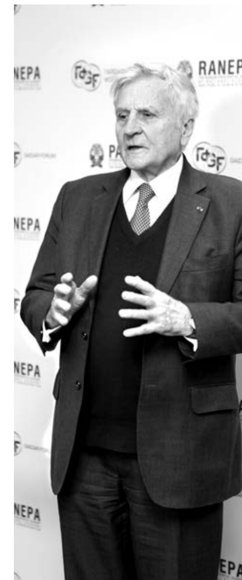
Председатель «Группы тридцати» Жан-Клод Трише: «Россия имеет огромное геополитическое влияние, это мировая держава»