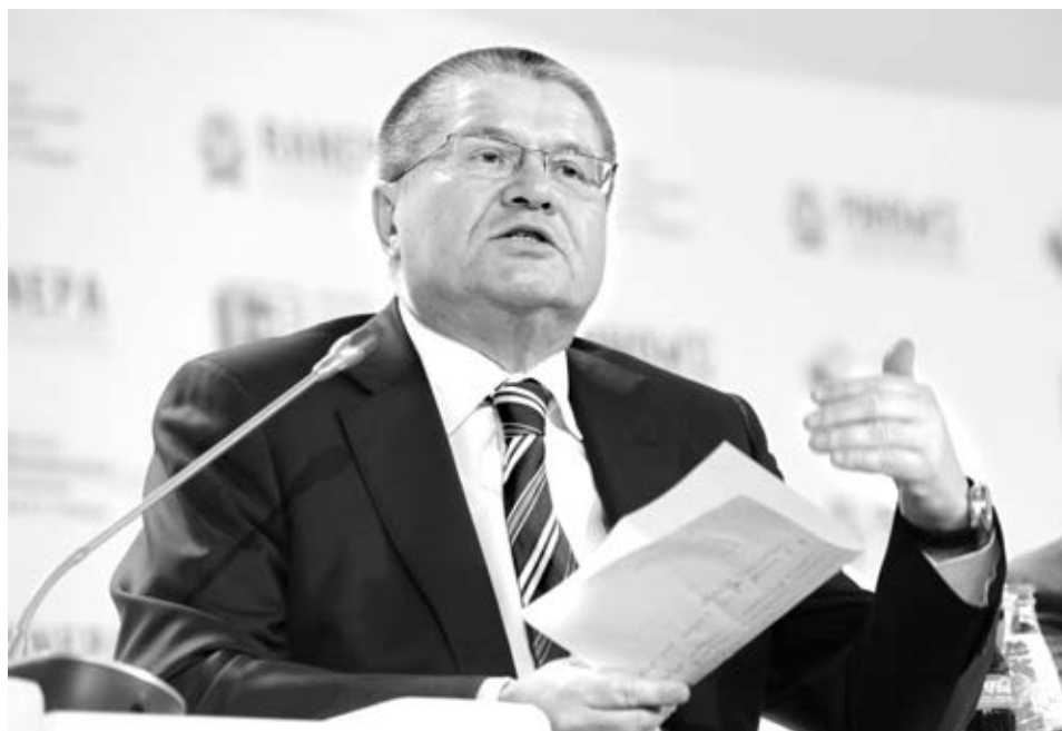
Министр экономического развития РФ Алексей Улюкаев: «Для бюджета важно не сколько стоит нефть в долларах, а сколько она стоит в рублях»

В первый день работы Гайдаровского форума — 2015 прошло 13 мероприятий. Ключевым событием стала дискуссия с участием председателя Правительства РФ Дмитрия Медведева.