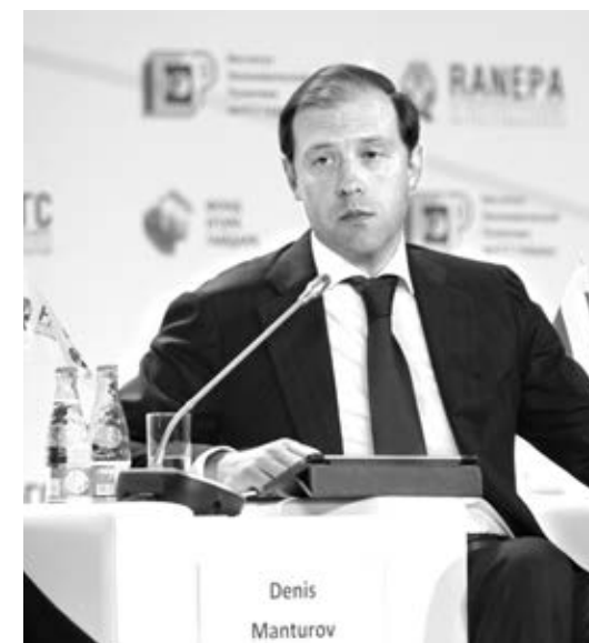
Глава Минпромторга Денис Мантуров: «Сейчас из предприятий гражданского сектора технологии перемещаются в ОПК»

В ходе второго дня работы ГФ-2015 прошло более 30 мероприятий с участием ведущих российских и зарубежных экспертов в области экономики, политики и социальной сферы.