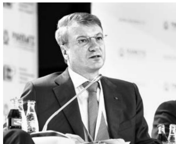
Глава Сбербанка Герман Греф: «Если цена отскочит до какого-то уровня, нам все равно надо решать структурные проблемы экономики»